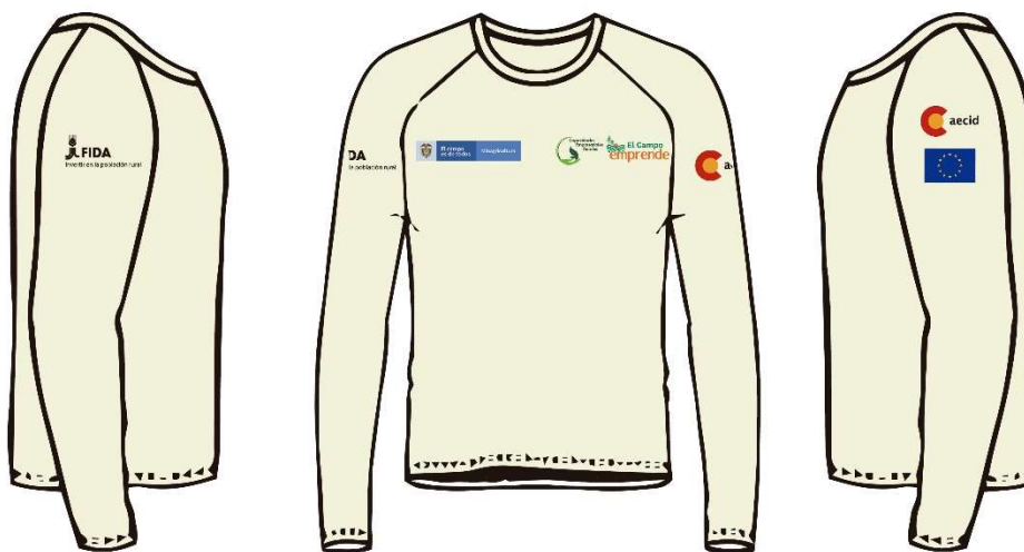
Imagen 6. Referencia para la ubicación de logos en camibuso manga larga

7 103 Chalecos impermeables, bordados, color beige – número de tono Centauro 8650 (52 para mujeres y 51 para hombres)