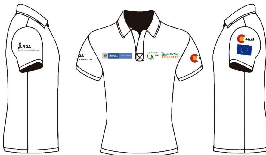
Imagen 5. Referencia para la ubicación de logos en camiseta tipo polo

6 Total: 124 Camibusos manga larga, estampados, color beige (62 para mujeres y 62 para hombres)