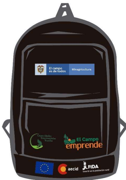
Imagen 2. Referencia para la ubicación de logoss en morral

En la parte frontal inferior: 1 logo de FIDA, 1 de AECID y 1 logo de UE, cada uno de 3 cm de alto x 6,5 de largo.