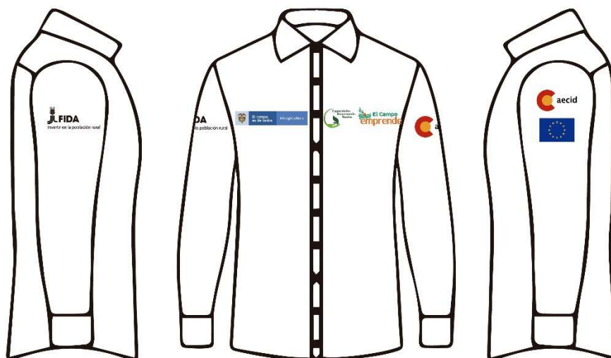
Imagen 4. Referencia para la ubicación de logos en camisa tipo Oxford

5 Total: 101 Camisetas tipo polo, manga corta, bordadas, color blanco (51 para mujeres y 50 para hombres)